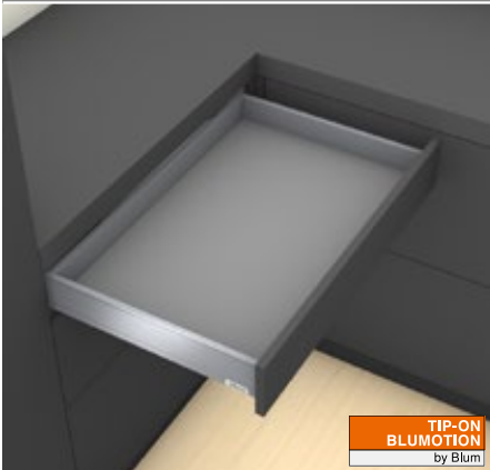
TIP-ON BLUMOTION by Blum